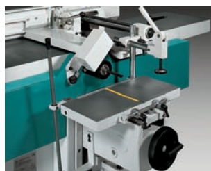
Option Mortising attachment Langlochbohrereinrichtung Пазовальный узел