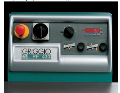
Option (PF 430) In-feed automatic table adjustment Motorisierte Einstellung des Einlaufisches Электрическая регулировка стола на входе Electronic read-out unit Digitalanzeige der Hobelwerte Цифровой электронный визуализатор параметров