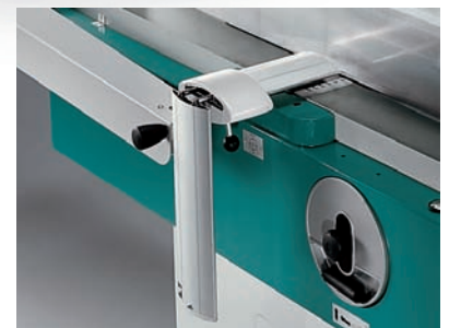
Standard (PF 430-PF 530) - Option (PF 530R) Two-side folding spindle safety guard "CE" "CE" Zweiteilige Hobelwellschutzabdeckung Базовая комплектация (PF 430-PF 530) Опция (PF 530R) Защитное устройство CE, складывающееся пополам