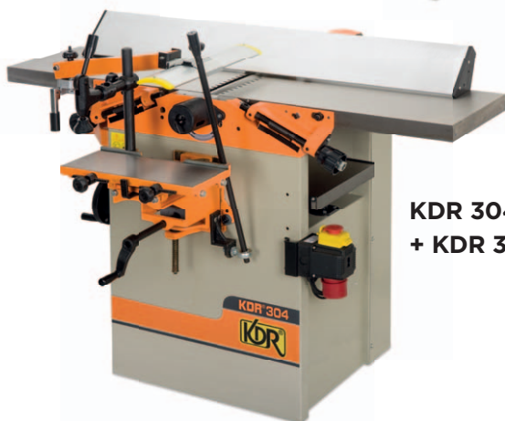
KDR 304 + KDR 392

Kombinovaná srovnávací a tloušťkovací frézka tuhé konstrukce s velkým podílem litiny, která dovoluje použití pro náročné kutily a řemeslníky. Počet otáček a konstrukční provedení nožového hřídele zajišťují vysokou kvalitu obrábění. Standardně je vybavena strojním posuvem pomocí dvou odvalovacích válečků, na vstupu rýhovaným válečkem, na výstupu hladkým válečkem. Dále výbava zahrnuje naklápěcí pravítko, bezpečnostní kryt nožového hřídele, odklápěcí stoly a překlopný kryt s odsávací hubicí.